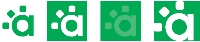
Elementos Complementarios: Normal, Calado I, 100%-80% y Calado II (Verde)