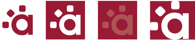
Elementos Complementarios: Normal, Calado I, 100%-80% y Calado II (Rojo)