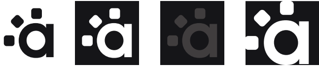
Elementos Complementarios: Normal, Calado I, 100%-80% y Calado II (Negro)