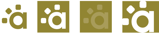
Elementos Complementarios: Normal, Calado I, 100%-80% y Calado II (Amarillo Oscuro)